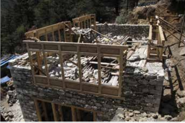
Yeni bir bina inşa edilirken