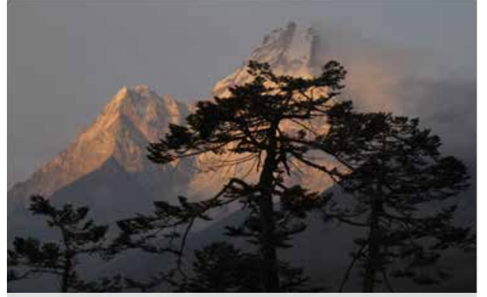
Tyhangboche'de Gün batışında Amadablam Zirvesi

Öğlen yemek yiyip devam ediyoruz. 14:30 gibi son kamp olan Gorakshep 5270 metre kampındayız.