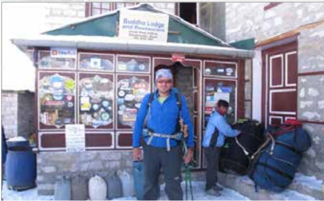
Gorakshep 5270 metre.