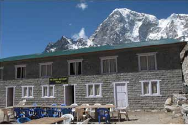
4620 Thukla Kampı