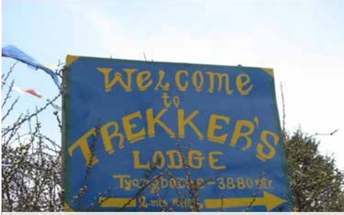
Tyhangboche 3867 metre