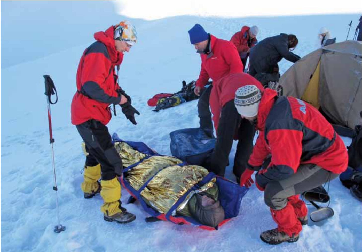
Niğde Aladağlarda tırmanış sırasında rahatsızlanan Ukraynalı dağcının kurtarılışı.