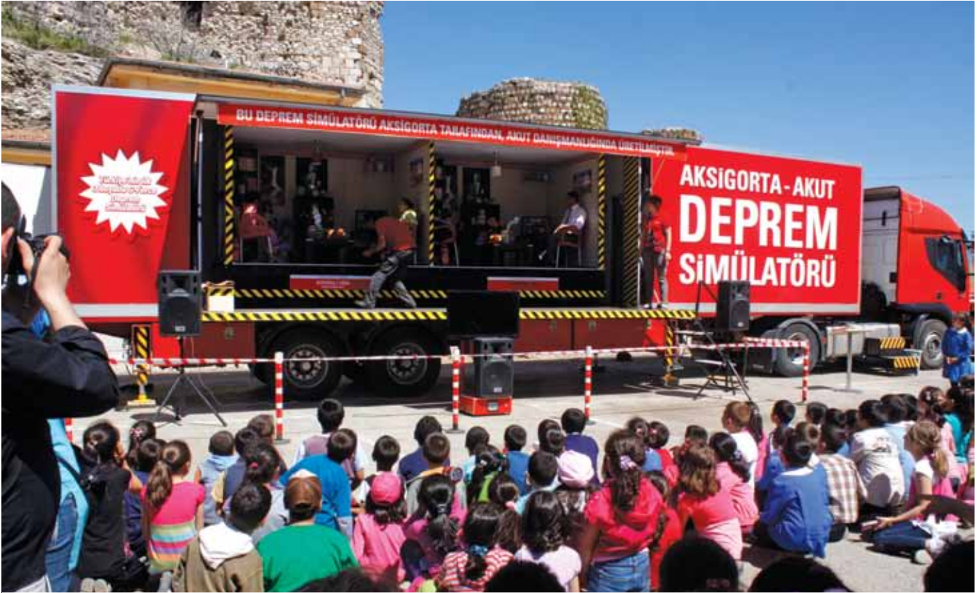
AKUT Tır'ı Sosyal Sorumluluk Projesi kapsamında tüm Türkiye'yi dolaşiyor. İçerisinde deprem simülatörü bulunuyor.

sorunca zaten imrenerek takip ettiğim AKUT'un içerisinde kendimi buluverdim.