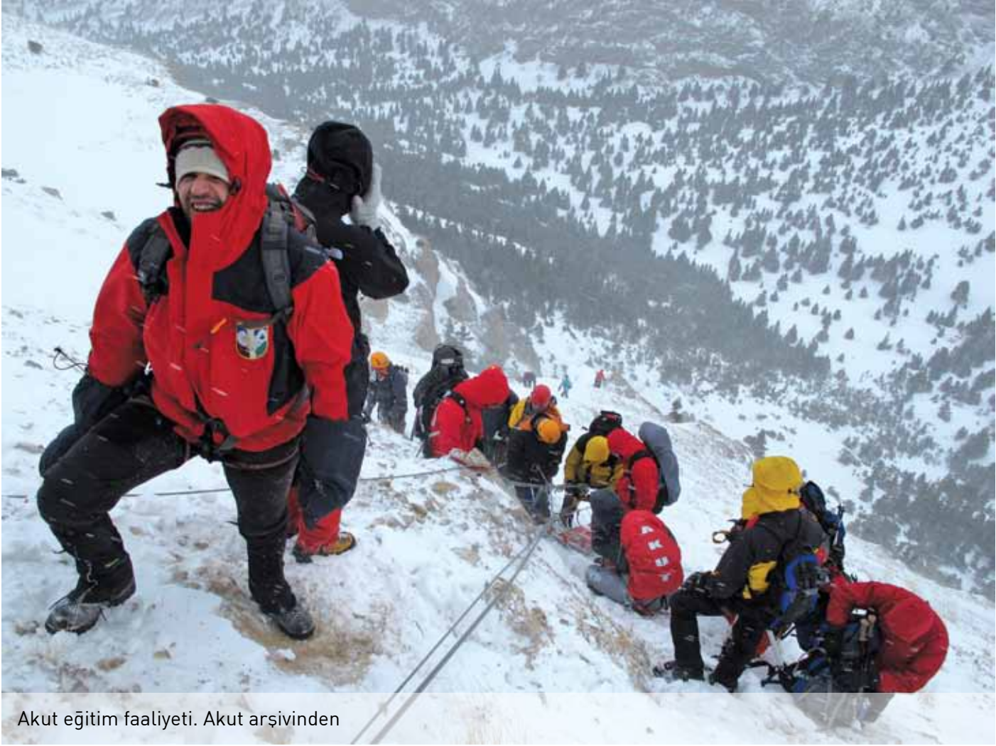
Akut eğitim faaliyeti.

nabiliyor bir kar motosikletini de. Bütün bunların eğitimleri düzenli olarak veriliyor.