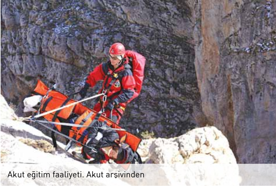
Akut eğitim faaliyeti.

önemli, ya da sadece hayırseverlerin bağışlarıyla ayakta duran AKUT'a küçük bir bağış bizlerin bu sorunlarla uğraşmak yerine esas amacımıza ulaşabilecek tekniklerle uğraşmamızı sağlayacaktır. Tabi ki bütün bunlar bir bütçe gerektiriyor ve kullandığımız malzemelerin bir ömrü var.