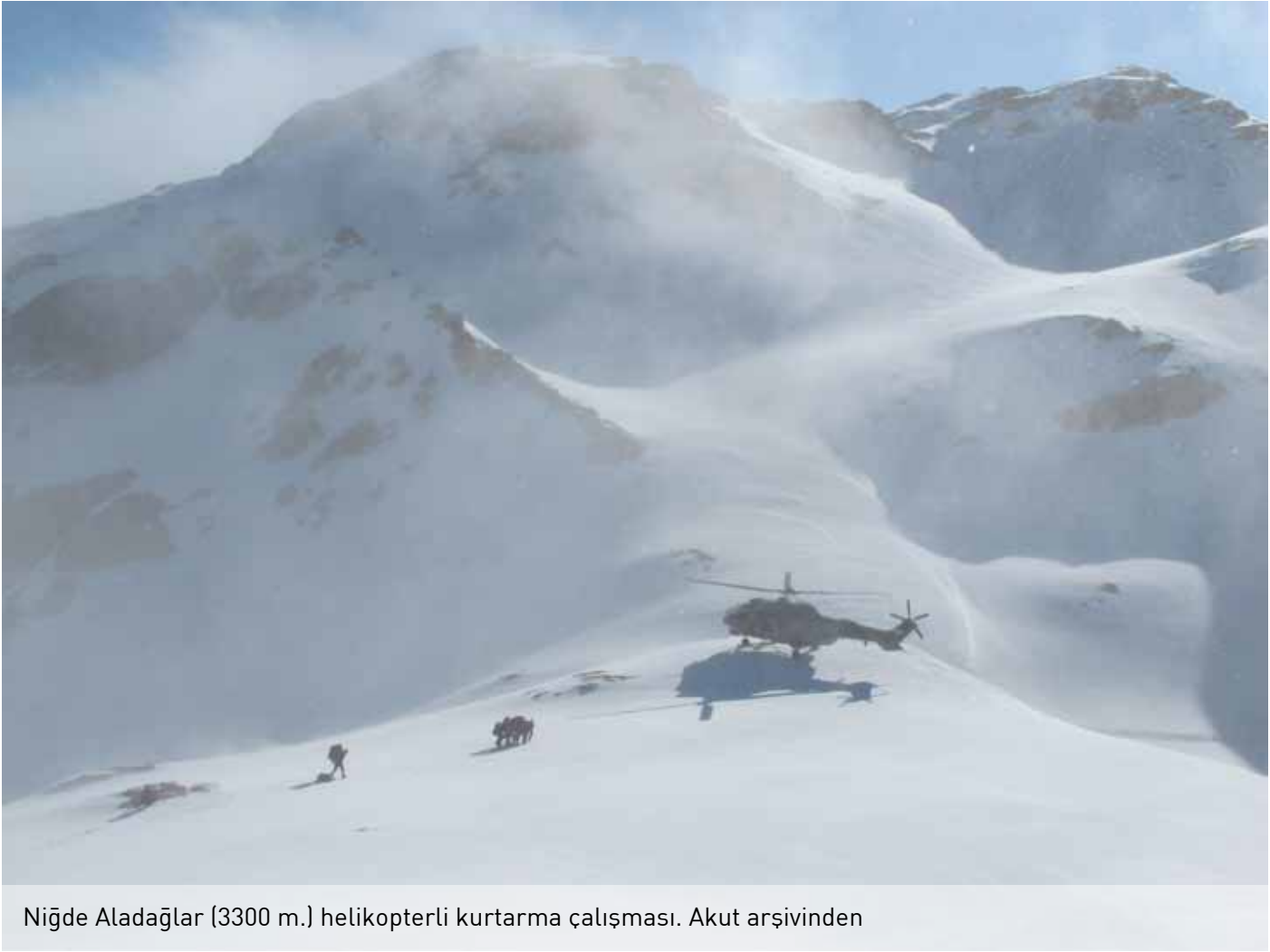
Niğde Aladağlar (3300 m.) helikopterli kurtarma çalışması.

değişik bölgelerinde 27 adet temsilciliği bulunan bir dernek. Mali yapı İstanbul'dan idare ediliyor. Merkez ekip olan İstanbul yapısında yönetim kurulu ve buna bağlı olarak farklı alanlarda birimlerden oluşuyor. Lojistik destek, iletişim, ulaşım, gibi birimler temsilciliklerin ihtiyaçları ve arama kurtarma faaliyetinin başarılı olabilmesine yönelik çalışmalar yürütüyorlar. Kısaca komuta merkezi diyebiliriz. Özellikle birden fazla ekibin katıldığı operasyonlarda merkez gerekli organizasyonu ve planlamaları yapıyor.