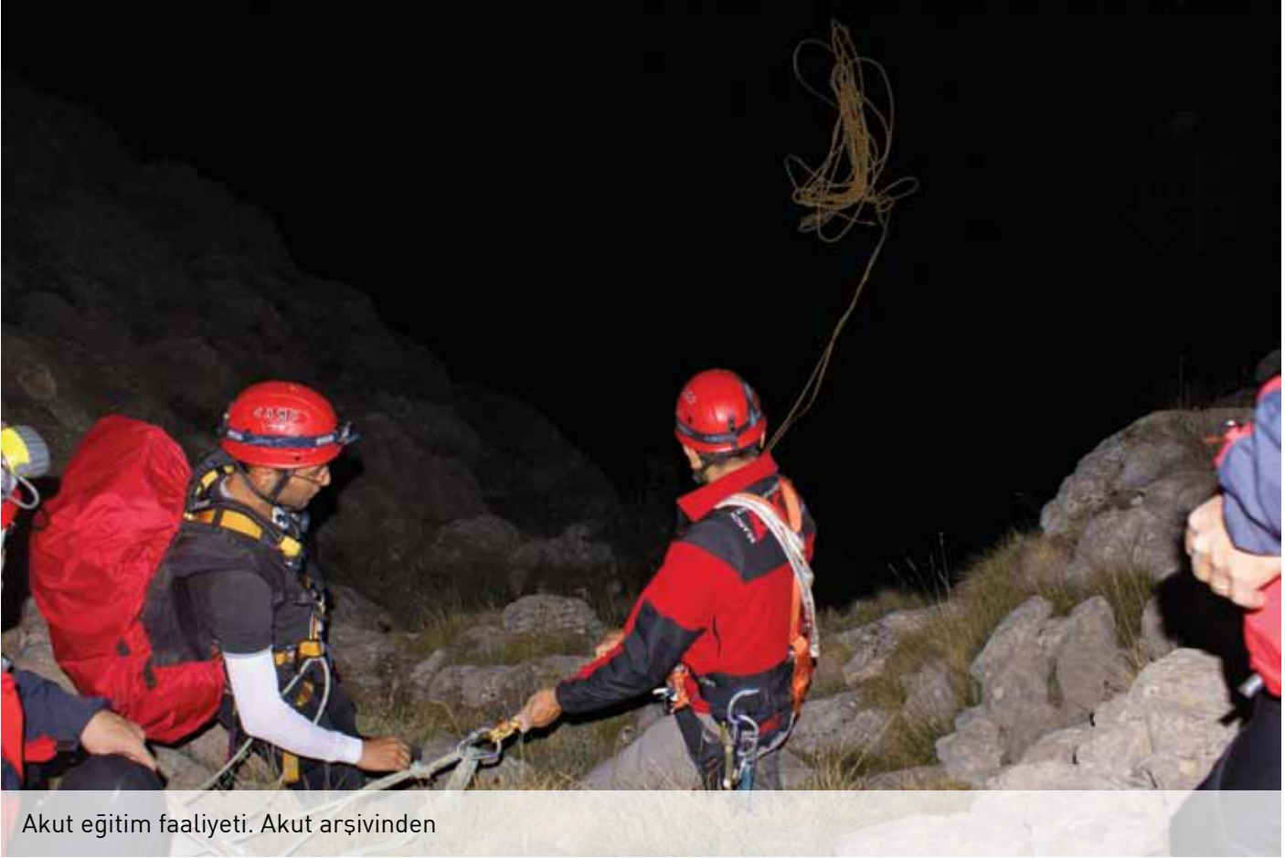
Akut eğitim faaliyeti.

A KUT Arama Kurtarma Derneği olarak, gönüllülük ve karşılıksız yardımseverlik ilkeleriyle tam 16 yıldır durup dinlenmeden, varlığımızı adamaya karar verdiğimiz Türk Milleti ve Türkiye için çalışıyoruz.' sloganıyla bu gün Türkiye genelinde toplam 27 ekip ile arama kurtarma çalışmaları yürütmeye devam ediyor. 1996 yılı başında AKUT Arama Kurtarma Derneği resmen kuruldu.