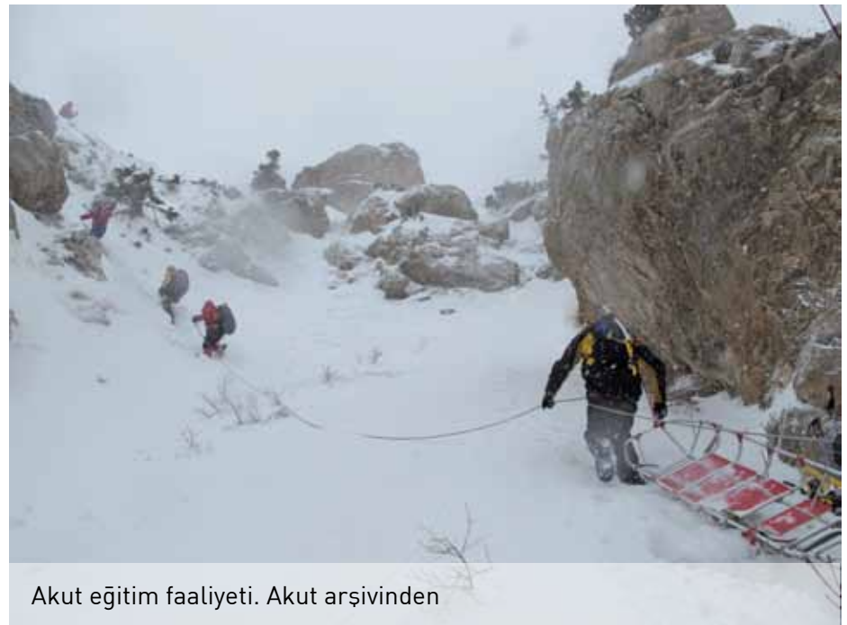
Akut eğitim faaliyeti.

Bir de şöyle bir gerçek vardı deprem sırasında yaşanan kayıplar buz dağının sadece görünen kısmı. Gerçek hasar yıllar sonra ortaya çıkıyor ve hem ekonomik hem de sosyal olarak ülke halkını çok etkiliyor. Özellikle devletin doğal afetlere tedbir olarak arama ve kurtarma ekiplerine ağırlık vermektense daha çok yıkılacak ya da zarar verecek etkenleri ortadan kaldırmaya çalışması gerekir. Dediğim gibi, yıkılan bir binadan ceset çıkartmak için organize olmak yerine o binayı depremden önce yıkmak daha kolay ve etkili sanırım.